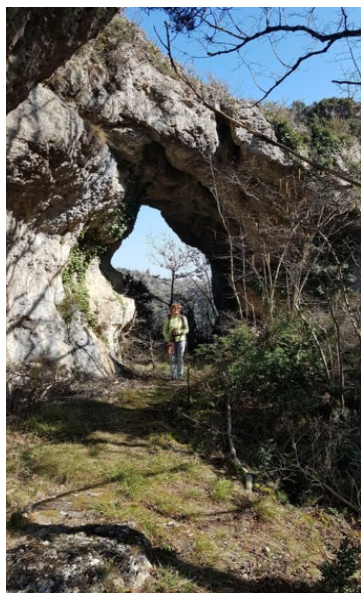
Une autre arche naturelle